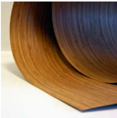
Moso® Placage Vertical Caramel