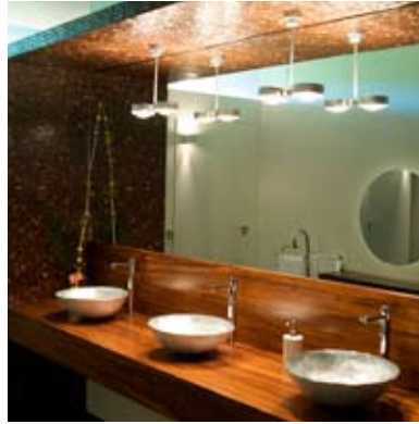
Moso® Placage Density Caramel