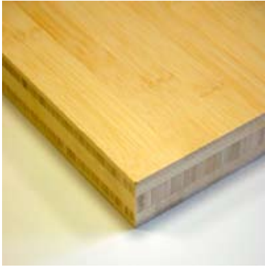
Moso® Panneau Massif Horizontal Naturel