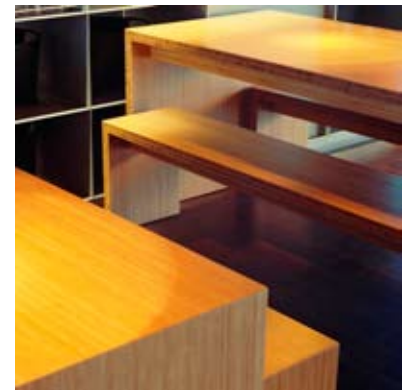
Moso® Panneau Massif Vertical Naturel