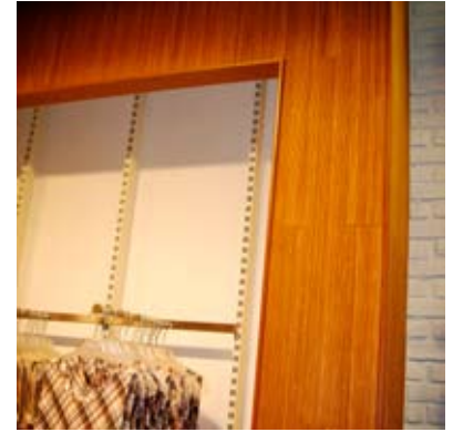
Moso® Bambou en rouleau Panda Caramel